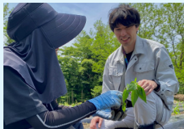
▲協力隊の現場巡回

このコーナーでは、普段なかなか目にしない業務にもスポットを当てて市役所の仕事を紹介します！