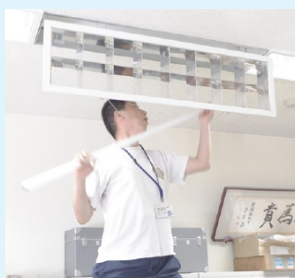
▲連絡が入ればすぐに交換へ

庶務係は、主に市役所の庁舎や駐車場などの維持管理や環境整備、自治会に関する仕事をしています。庁舎の電球が切れた時の交換や、職員でできる範囲の修理もしています。