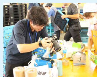
▲取材中の広報担当

主な業務内容は、市長の公務スケジュールの調整などを行う秘書業務、自治会活動や市民活動を支援する市民協働業務、ふるさと納税業務、そして、この広報紙の作成や市のホームページ、市公式LINEなどのSNSを管理する広報広聴業務と、大きく4つの業務を行っています。