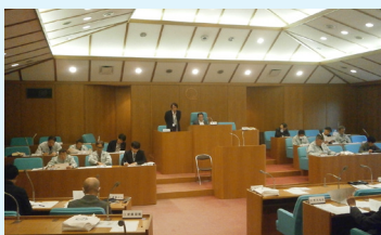
▲ 農業委員会総会の様子

農業委員会事務局は笹神支所の3階にあり、職員8人で業務にあたっています。農業委員15人と農地利用最適化推進委員11人で、農地の最適化活動や地域計画のブラッシュアップ（更新）に向け活動しており、事務局ではそのサポートを行っています。そのほか、月末に総会を開催し、農地の貸し借りや売買、農地以外の用途に使用するための農地転用などを農業委員から審査してもらい、許可などの事務処理を行っています。