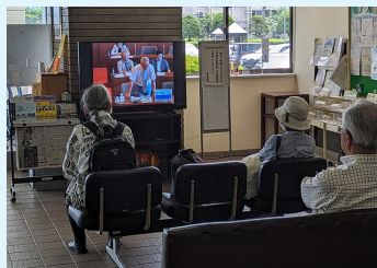
▲市役所 玄関ホールで生配信

この他、原則本会議の翌月に議会だよりを発行したり、市ホームページで本会議の会議録を公開したりしています。