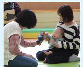
▲「にこにこリトミックでのお名前呼びの様子

子どもや障がいのある方、援護が必要な方など、さまざまな方を支援しており、一つひとつ業務を紹介しきれませんが、今回は写真とともに2つの取り組みを紹介します。右の写真は子育て支援センターにこここでの「にこにこリトミック」の様子です。こここのお名前呼びの様子にここでは、毎月、親子が楽しくふれあえる催しをたくさん企画して運営しています。