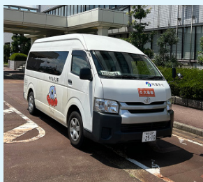
▲AI オンデマンドバスが10月に稼働 (3ページ参照)

交通対策係は、主に市営バスの運行や交通安全、防犯活動に関する仕事をしています。駅やバス停周辺などの維持管理のため草刈りもしており、その際はつなぎ服に着替え、汗だくで草刈りをしています。