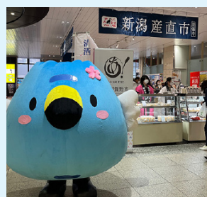
▲さまざまなイベントで大活躍のごずっちょ

ふるさと納税をとおして全国の皆さんから市を知ってもらう。また、広報活動により、市を知ったから寄付をする。このように、ふるさと納税業務と広報業務は「持ちつ持たれつ」という言葉がぴったりの、互いに阿賀野市を市内外