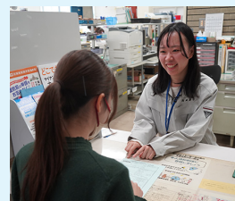
▲気持ちの良い対応を心掛けています

市役所というところを思い浮かべる人も多いのではないのでしょうか。子どもが生まれたとき、引っ越しをするとき、結婚をするとき、亡くなったとき。人生の節目節目での届け出、この受け付けをしているのが市民係です。このほかにも住民票などの証明書の発行やマイナンバーカードやパスポートの申請受け付けや交付もしているのが市民係です。このほかにも住民票などの証明書の発行やマイナンバーカードやパスポートの申請受け付けや交付もしているのが市民係です。このほかにも住民票などの証明書の発行やマイナンバーカードやパスポートの申請受け付けや交付もしているのが市民係です。