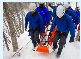
▲ 積雪期山岳救助訓練