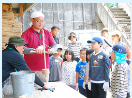
▲はじめてのキャンプ (火起こし体験)

このコーナーでは、普段なかなか目にしない業務にもスポットを当てて市役所の仕事を紹介します！