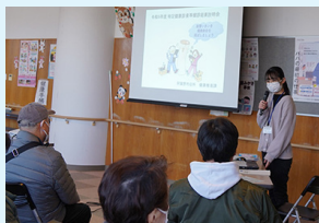
▲慢性腎臓病を紹介

右の写真は特定健診等結果説明会の様子です。“新たな国民病”と呼ばれている「慢性腎臓病」を紹介しました。良くない生活習慣により腎臓に負担がかかると慢性腎臓病になり、重症化すると脳卒中や心筋梗塞などに陥ります。健診結果で、尿にたんぱくが多い人やGFR値が低下している人は要注意です。