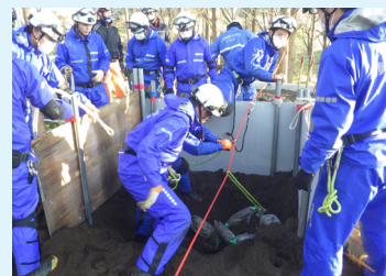
▲ 土砂埋没救助訓練

また、教育訓練や資格取得のため、消防学校や消防大学校、救急救命研修所に入校したり、