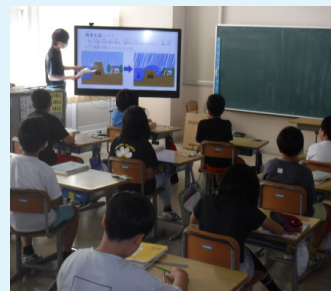
▲小学校で防災講座を開催

平常時には、市の地域防災計画をはじめとする各種計画や防災ハザードマップを整備したり、自治会や小中学校に出向き、防災講座などを開催しています。