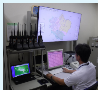
▲防災行政無線を配信

その他、警察、消防と連携した山岳遭難や行方不明事案の捜索も危機管理課の業務になっています。