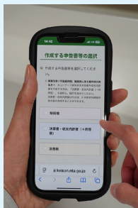
▲スマホで気軽に申告できます

令和4年の申告相談会からは、混雑緩和・感染症拡大防止のため完全予約制で実施しています。また、紙による申告の他にパソコンやスマートフォンから国税庁ホームページで申告書を作成することも可能です。