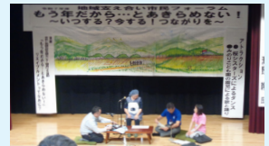
▲地域支え合い推進員と共に市民フォーラムの劇に出演

それぞれのセンターには、主任介護支援専門員、保健師、社会福祉士などの専門職がおり、介護予防の働きかけや、介護が必要になっても望む生活を続けるためのサポート、支え合いの地域づくりのお手伝いなどを行っています。