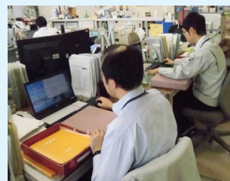
▲電子入札で事業者の負担を軽減

お願いする仕事は皆さんからの税金で賄うため、その仕事が良質であり、さらに適正な価格でなければいけません。そのため、入札に参加する相手方について、条件どおりの仕事ができるか事前に要件などのチェックを行います。そして、入札に参加してもらって金額の一番低い相手方と契約します。