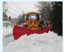
▲日中は自ら除雪車を走らせることも

体力が必要とされる業務もありますが、これからの市民の皆さんの安全安心のために取り組んでいきます。