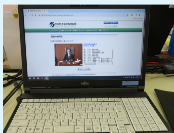
▲ホームページで中継

また、市民の皆さんから議会活動に関心を持ってもらうため、速やかな情報発信に努めています。