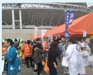
▲ビッグスワンのイベントでブースを設けてPR

観光係は、市の豊かな自然や歴史、文化を生かした観光振興の最前線にいます。季節ごとの観光イベントの企画・運営や、新しい観光資源の活用策の検討など、市民の皆さんとともに市の魅力をPRするため日々奮闘しています。