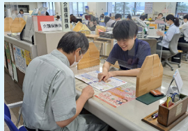
▲介護保険制度について窓口で説明

介護が必要になったときの申請受け付けや制度説明、介護度の認定や介護保険料の決定、将来を見据えた事業計画の策定など、介護保険に関する事務全般を担っています。