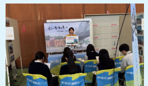
▲企業発見フェアの様子

6月17日には事業者と就業希望者のマッチングの機会として「企業発見フェア in あがの」を初開催しました。来年も開催予定なので、期待しててください！