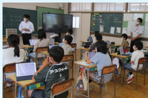
▲小学校で行われた租税教室の様子

税務課で心掛けていることは、公平公正な賦課と徴収です。将来を担う児童・生徒から税金の意義や役割を正しく理解してもらうために、学校に出向き租税教育も実施しています。