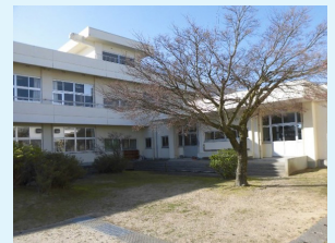
▲閉校施設 (旧分田小学校)