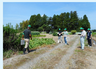
▲ 農地パトロールの様子

農業委員、推進委員は日々、農地の見回りや耕作者から相談を受けるほか、農地の集約に向けた話し合いを進める「担い手会」やその広域的な調整を図る「区域会」の司会やコーディネーター役として活躍しています。