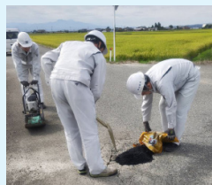
▲道路の損傷を補修

そういった係ごとの業務の他に、冬場の除雪業務は課全体で協力して行っています。4班体