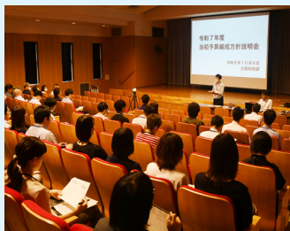
▲当初予算編成方針の説明会を実施

また、移住希望者の相談の受け付けや、結婚したい人を支援する仕事もしています。さらにInstagramで情報発信している地域おこし協力隊もこの係に所属しています。