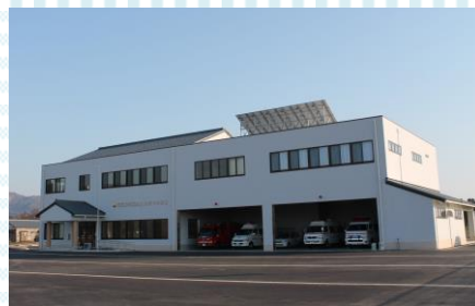
かがやき分署庁舎