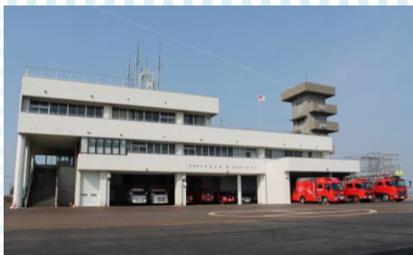
阿賀野市消防本部庁舎