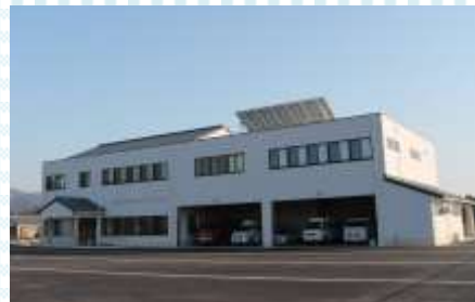
かがやき分署庁舎