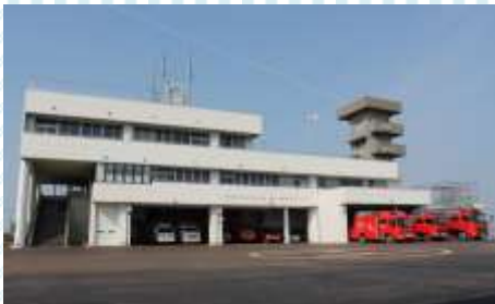
阿賀野市消防本部庁舎