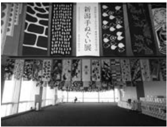
▲手ぬぐい展の様子

日 現在開催中(6月23日(日) 午前8時～午後10時(最終入場午後9時30分) ※都合により休館する場合あり 場 Befcoばかうけ展望室(朱鷺メッセ31階・新潟市中央区万代島5-1) 主催 越後亀紺屋 藤岡染工場 協力 新潟県地場産業振興課地場産業・日本酒振興室 協賛 公立大学法人長岡造形大学 問 越後亀紺屋 藤岡染工場 ☎ 62-2175