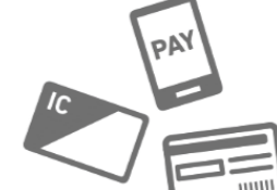
③決済サービスID/セキュリティコード

パスワードはマイナンバーカードの申請時or受取時にご自身で設定した「数字4桁」です。