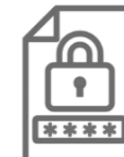
②数字4桁のパスワード(暗証番号)

パスワードはマイナンバーカードの申請時or受取時にご自身で設定した「数字4桁」です。