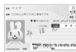
①マイナンバーカード