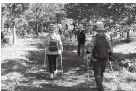
▲ウォーキング中の様子

専用のポールを使うことで足腰の負担を減らし、正しいフォームも維持できるノルディックウォーキングを、この機会に体験してください。