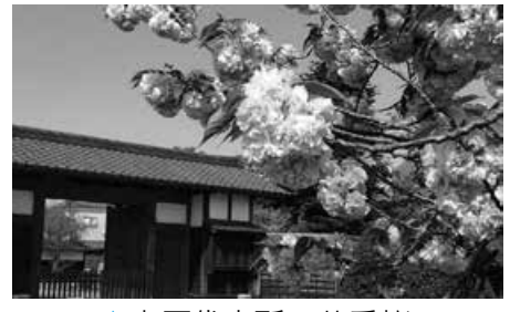
▲水原代官所 八重桜

水原代官所では、八重桜が毎年きれいな花を咲かせます。二日間は大門から水原代官所に入館できますので、ぜひ見に来てください。 日 4月19日(土)、20日(日) 午前9時30分～午後3時30分 場 水原代官所 参 大人300円/人、小学生～高校生200円/人 問 商工観光課 観光係 ☎62-2510(内線2342) ID 114300