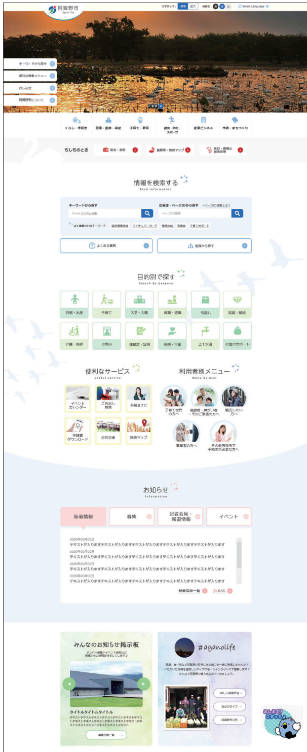
トップページのパソコン表示