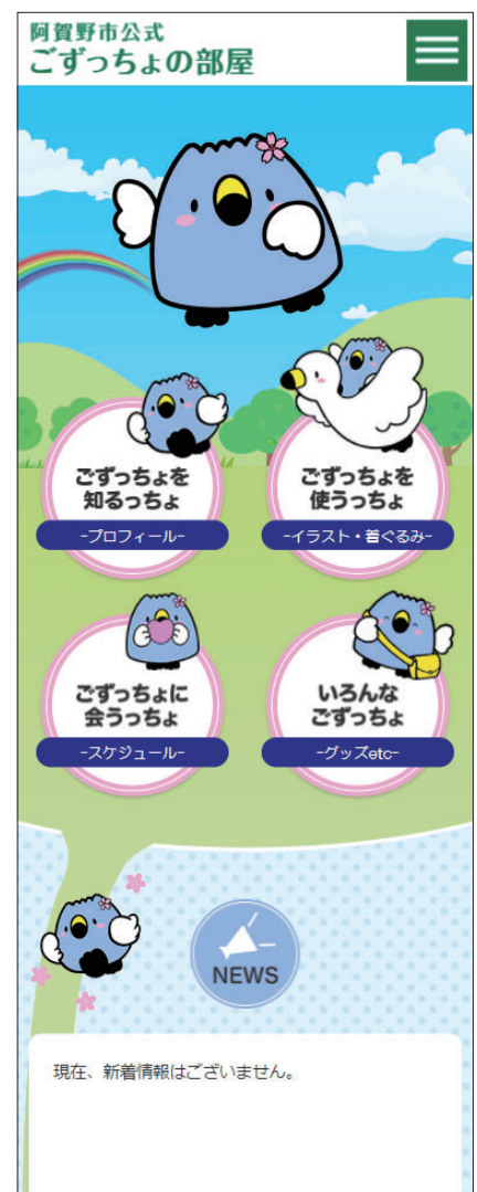
左から、シティプロモーションサイト、子育て支援サイト、ごずっちょサイトのスマートフォン表示