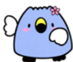
阿賀野市イメージキャラクター 「ごずっちょ」

内 容：人事異動に伴う給与費の減額や人間ドックの受診者増加に伴うあがのポイント付与金の増額を計上します。また、新型コロナウイルス感染症に係る国庫補助金の増加に伴う設備整備事業費の増額を計上します。