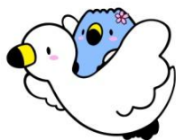
阿賀野市イメージキャラクター 「ごずっちょ」