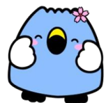
阿賀野市イメージキャラクター 「ごずっちょ」

新潟県阿賀野市役所 総務部 市長政策課 〒959-2092 新潟県阿賀野市岡山町 10 番 15 号 ☎ 0250-61-2502 FAX 0250-62-0281 E-mail : shichoseisaku@city.agano.niigata.jp URL : http://www.city.agano.niigata.jp/site/furusato-tax/