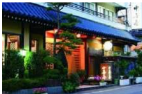
旅館中喜屋 心に残る素朴な宿