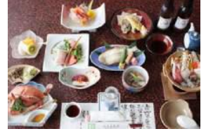
川上屋旅館 山懐のくつろぎ宿