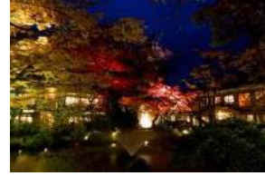
環翠楼 静かな森と 明治・大正 離れの宿