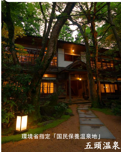
環境省指定「国民保養温泉地」