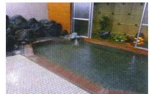
大石屋旅館 静かな寛ぎの宿