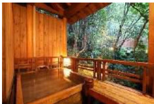
角屋旅館 ふるさとがしのばれる宿