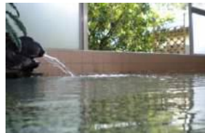
珍生館 湯治もできる宿