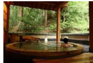
湯本館 山の馴染みの一軒家