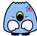
阿賀野市イメージキャラクター「ごすっちょ」

1万円以上寄附をされた市外の方全員に、 感謝 の気持ちとして、本市の特産や魅力が感じられる品物を贈呈いたします。