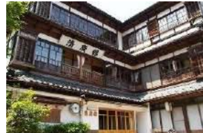
清廣館 国登録有形文化財 日本秘湯を守る宿