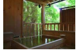
弓月 露天風呂付き客室 と貸切り家族風呂の宿