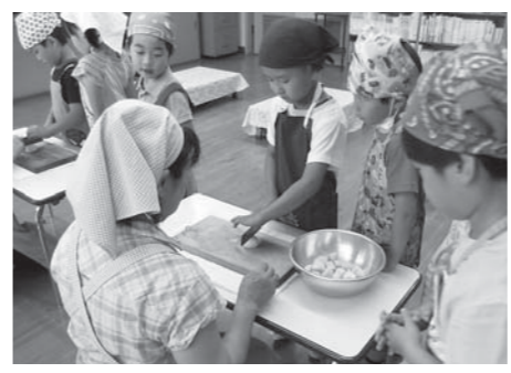
手元をよ〜く見て、ゆっくり切ろうね!

7月11日、京ヶ瀬幼稚園で年長組の園児による毎年恒例のカレー作りが行われました。カレーに入れるジャガイモも、幼稚園の畑で自分たちが育てたものです。その他の材料は、クラスのみんで買物に行ってきたそうです。 皮むき器で野菜の皮をむき、包丁で食べやすい大きさに切ります。みんな真剣な表情で、下ごしらえを行っていました。玉ねぎが目にした子は、お母さんの大変さを感じたそうです。