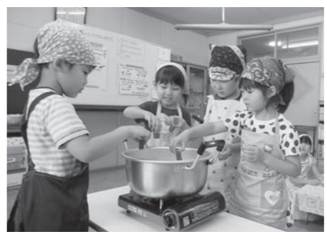
カレーの他に隠し味も入れたよ!

材料を鍋に入れて、いい香りがしてくると「もうすべ〜」と年中組や年少組の園児たちが見に来ていました。一生懸命に力を合わせて作ったカレーを全園児で食べると、「おいしいね〜」と笑顔がこぼれていました。