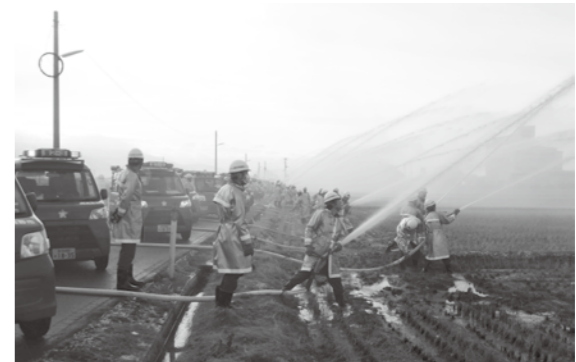
問 市消防本部 ☎62-2058