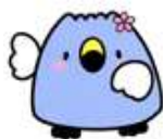
阿賀野市イメージキャラクター 「ごずっちょ」