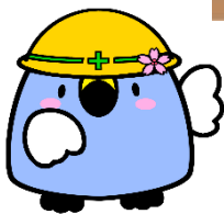
阿賀野市イメージキャラクター 「ごずっちょ」