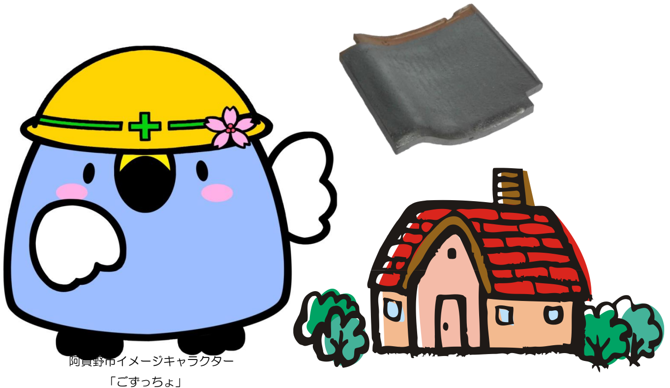
阿賀野市イメージキャラクター 「ごすっちょ」