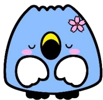
阿賀野市イメージキャラクター 「ごすっちょ」