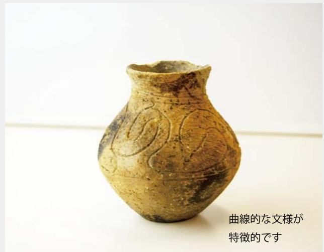
第6図 東北地方の土器(宝ヶ峯式土器)