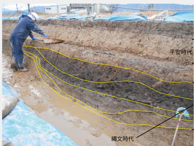
第3図 土層の堆積状況

今後は、これらの黒色土を上から順番に掘り下げて、上から新しい時代の土器、下から古い時代の土器が出てくるのかを確認していきたいと考えています。