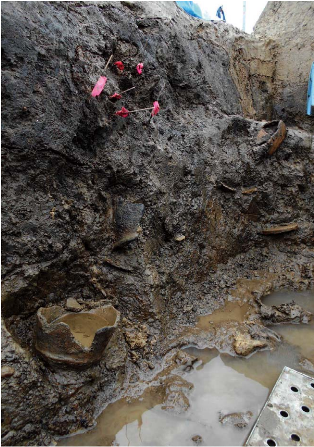
縄文土器の出土状況