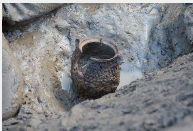
第4図 三十稲場式土器 出土状況