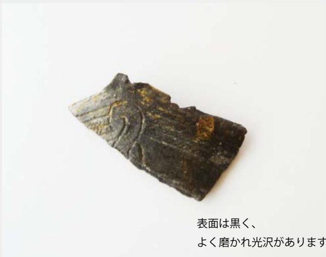
第5図 関東～信州地方の土器(堀之内式土器)

このように土器や石器から、縄文時代の土橋遺跡では様々な地域の人びとと交流していたことを知ることができます。