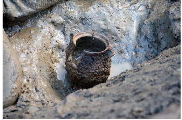
縄文時代後期（約4,000年前）の土器