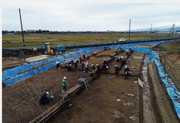
第2図 発掘調査のようす（B区）