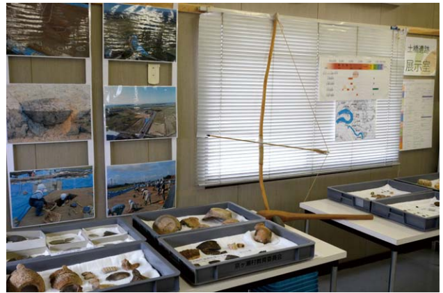
ミニ展示場のようす