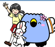
阿賀野市イメージキャラクター「ごすっちょ」