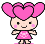
はあとふるあたごイメージキャラクター「はあとん」