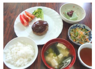
おいしく出来て、参加者も大満足でした。

次回は1月20日(水)に開催を予定しています。年齢や料理経験は問いません。男性の皆さんで食と健康に興味のある方、料理の基本から始めてみませんか。