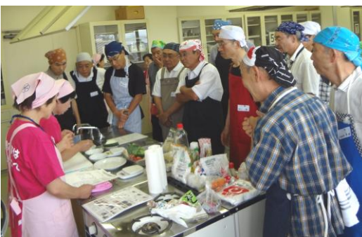
説明を聞く顔は真剣です！

今年度1回目は、7月1日(水)に14人の参加者で手作りハンバーグ作りに挑戦しました。参加者からは「楽しく参加できました。家でも作ってみたいです。」「また参加したいです。」などの感想が聞かれました。