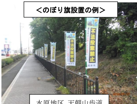
水原地区 天朝山歩道