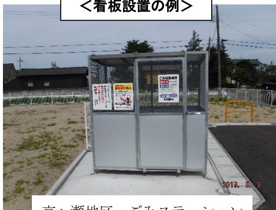
京ヶ瀬地区 ごみステーション