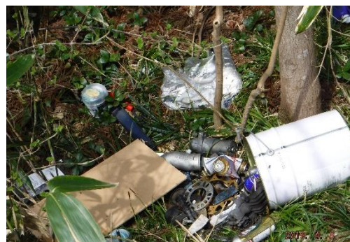
＜駐車場に投棄された車の部品など＞