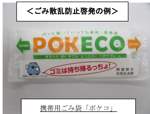
携帯用ごみ袋「ポケコ」 五頭山山開きで登山客に配布