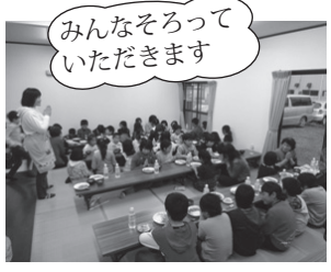
みんなそろっていただきます

「すいばらこども食堂」を開催 4月14日、おんこ茶屋で「すいばらこども食堂」が開催されました。 当日は、水原商工会女性部やクリエイティブユースなどボランティアの協力の下、80人の参加者を迎えて大盛況となりました。協力者の皆さんには、心より御礼申し上げます。 ★次回は6月10日(土)午後5時から開催します★ 引き続き、食材(米・野菜など)の提供をお願いします。提供可能な人は、おんこ茶屋まで連絡してください。 申し込み・問い合わせ：おんこ茶屋 ☎62-6706