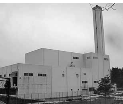
阿賀野市環境センター

答弁 平成18年度から23年度にかけて減量化が進んだが24年度は一転して101.78%に増加。減量化を図るため25年4月より3地区において古着古布のリサイクルを開始した。来年度から安田地区でも同様にリサイクルを行う予定で減量化に取り組む。