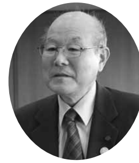
日本共産党 稲毛 明