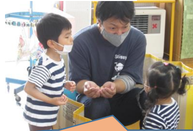
バスに乗ってドライブスルー！「ポテトください」 段ボールがバスになったりプールになったり