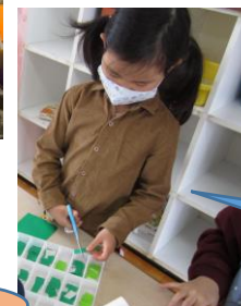
さかな釣りの餌づくり