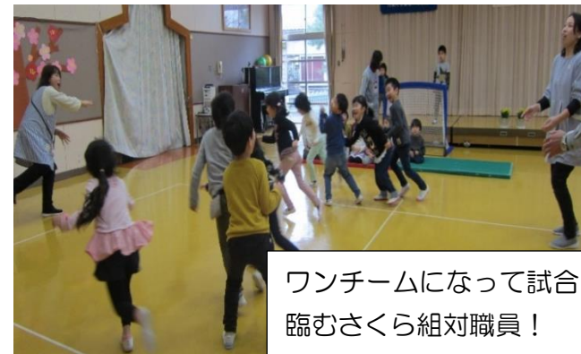
ワンチームになって試合に臨むさくら組対職員! 応援するうめ組!