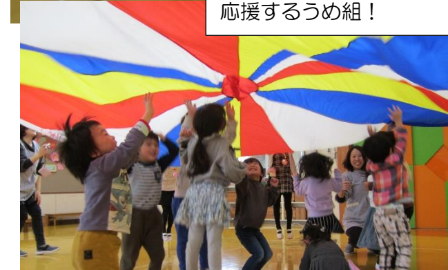
おめでとう会で、さくら組さんからバルーンの中に入れてもらい、大喜びのうめ組!