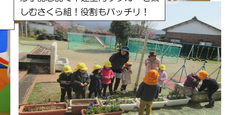
チューリップ歌をうたう うめ組さん うめ組さんの植えたチューリップ大きくなったよ! ♪咲いた 咲いたチューリップの花が♪