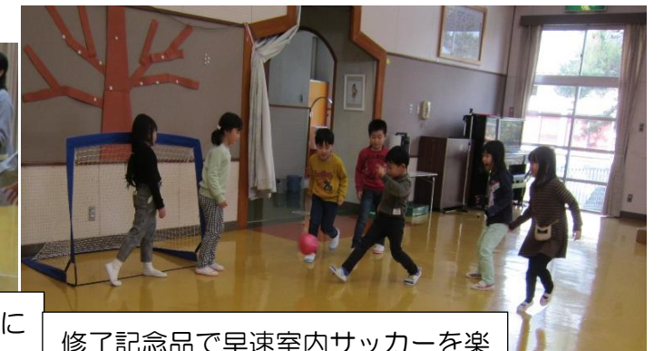
修了記念品で早速室内サッカーを楽しむさくら組! 役割もバッチリ!