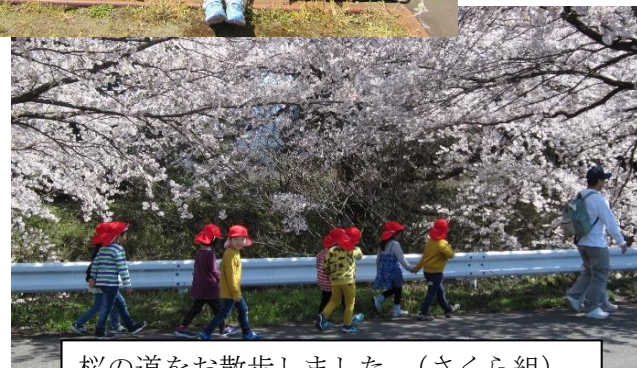
桜の道をお散歩しました。(さくら組)