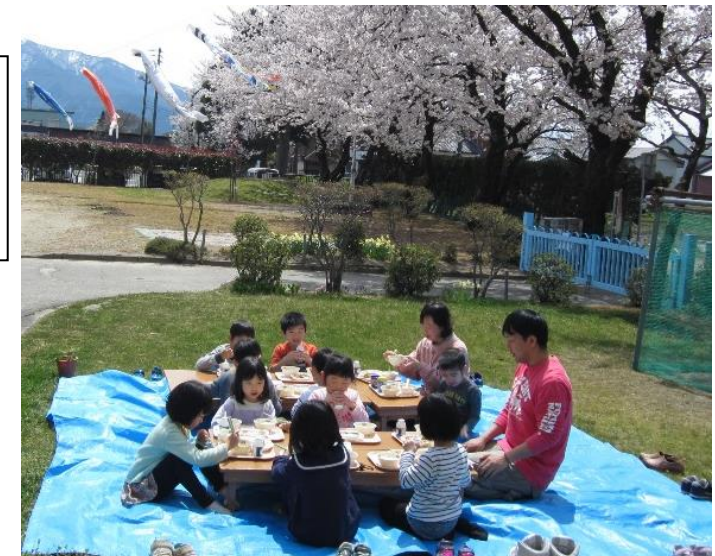
とても暖かい日、桜の咲いた園庭でお花見給食をしました。(さくら組)