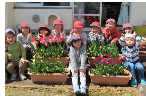
もも組さんの時に植えたチューリップがきれいに咲きました。(さくら組)