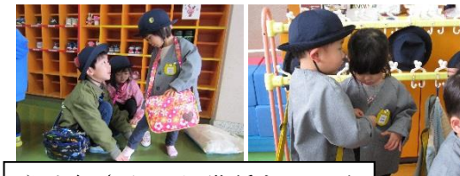
うめ組さんのお世話をしてくれています。(さくら組)