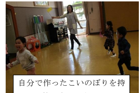
自分で作ったこいのぼりを持って一緒に走ります。(うめ組)