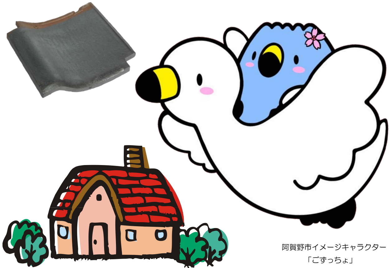
阿賀野市イメージキャラクター 「ごすっちょ」