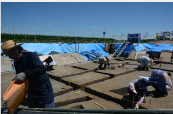
写真2 7月の調査状況(C区)