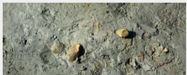
写真7 川跡の下の砂層から出土した軽石