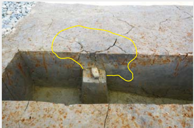
写真5 遺構の断面観察 (C区)