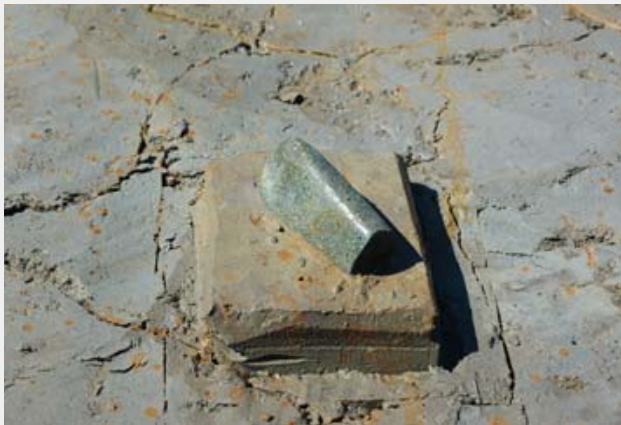
写真4 出土した石斧 (C区)

国土交通省北陸地方整備局 国土交通省国土地理院 2004『古地理で探る越後の変遷—荒川・阿賀野川・信濃川・関川・姫川—』