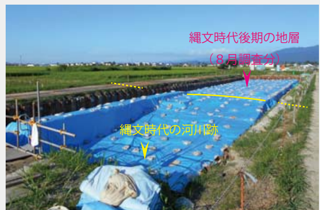
写真6 A区全景 (南西から)