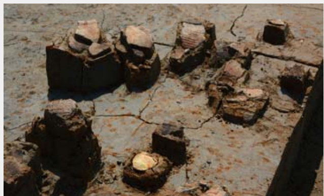
写真3 出土した縄文時代後期の土器(C区)