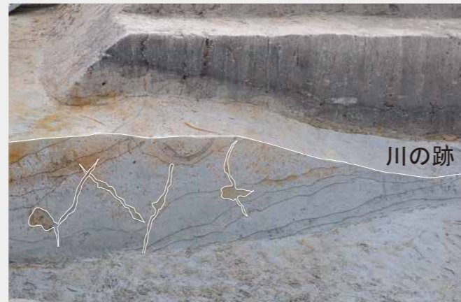
写真5 地震の痕跡 (噴砂)