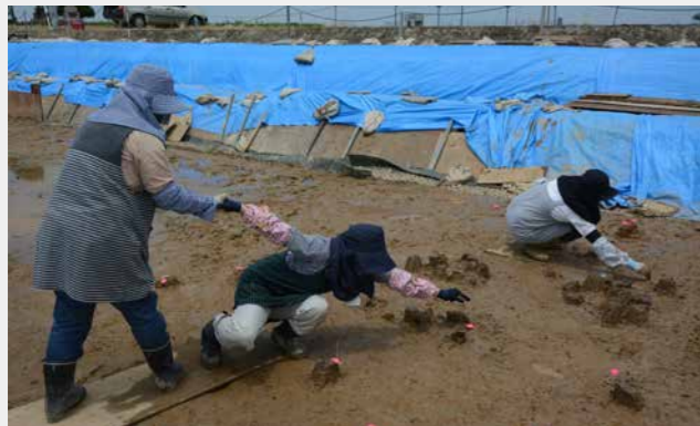
写真10 軟弱地盤での調査風景 （沈まないよう板に乗りながら調査）