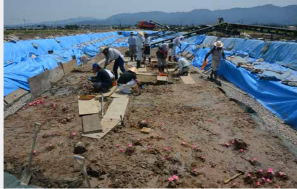
写真9 調査風景（手前ピンクリボンが土器の目印）