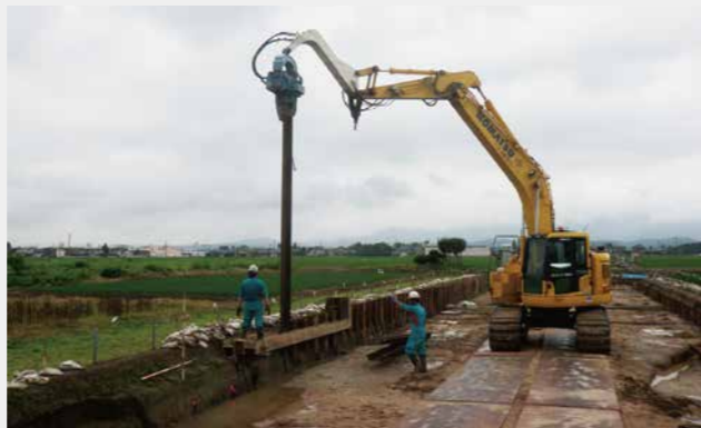
写真11 鋼矢板打設状況