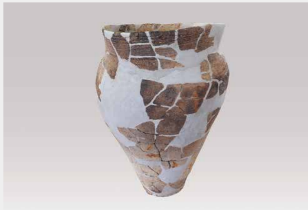
写真4 中層で出土した縄文土器