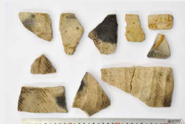
写真6 下層で出土した土器 (縄文時代中期)