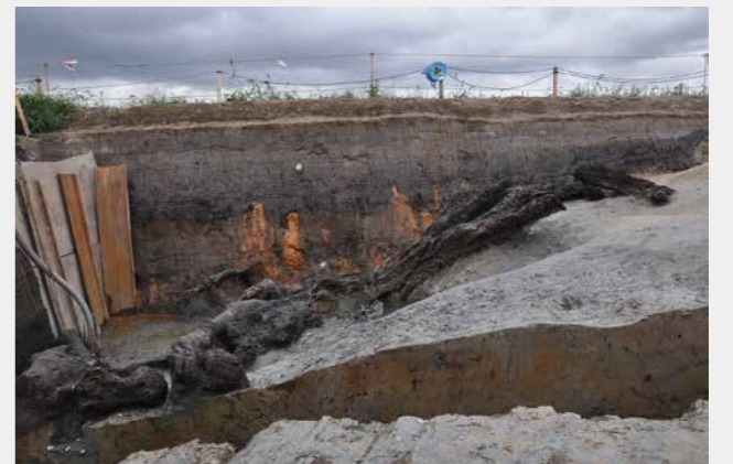
写真2 上層の川跡 流木の出土状況