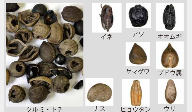
写真3 川跡出土の木の実・種（一部）