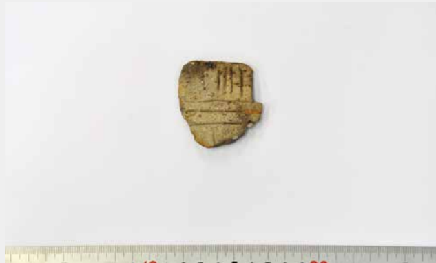
写真8 下層で出土した最古の土器（縄文時代中期）

縄文時代後期には、それまでの温かい気候から寒冷化がすすみ、人びとの暮らしが大きく変化したとされています。しかし、どのように変化したのか、その具体的な証拠は発掘調査では見つからないのが現状です。村北遺跡からその証拠が見つかるよう、今後も詳細な調査を進めていきたいと思っています。