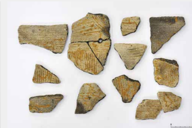
写真7 下層で出土した土器 (縄文時代後期)