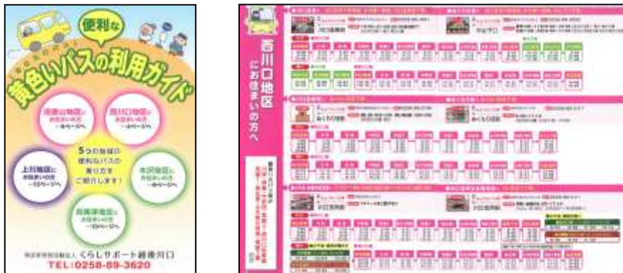
図 わかりやすい公共交通マップの例（川口地域 黄色いバス）