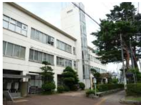
図 平成28年度現在の安田支所