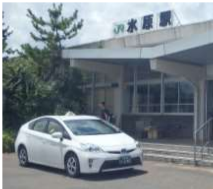
図 限定された需要に対応するタクシー