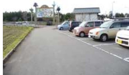
図 安田インターパークアンドライド駐車場