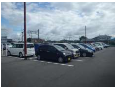
図 整備された駐車場(水原駅)