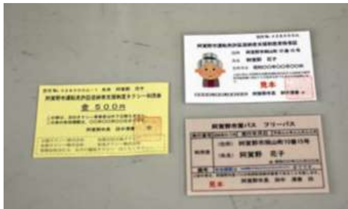
写真 現行の支援内容 (市内タクシー利用券、免許返納支援制度資格証、市営バスフリーパス)