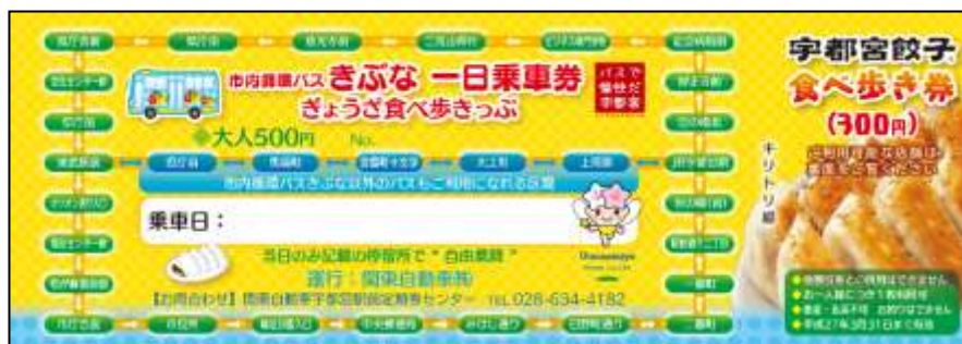
図 商店街とのコラボ乗車券