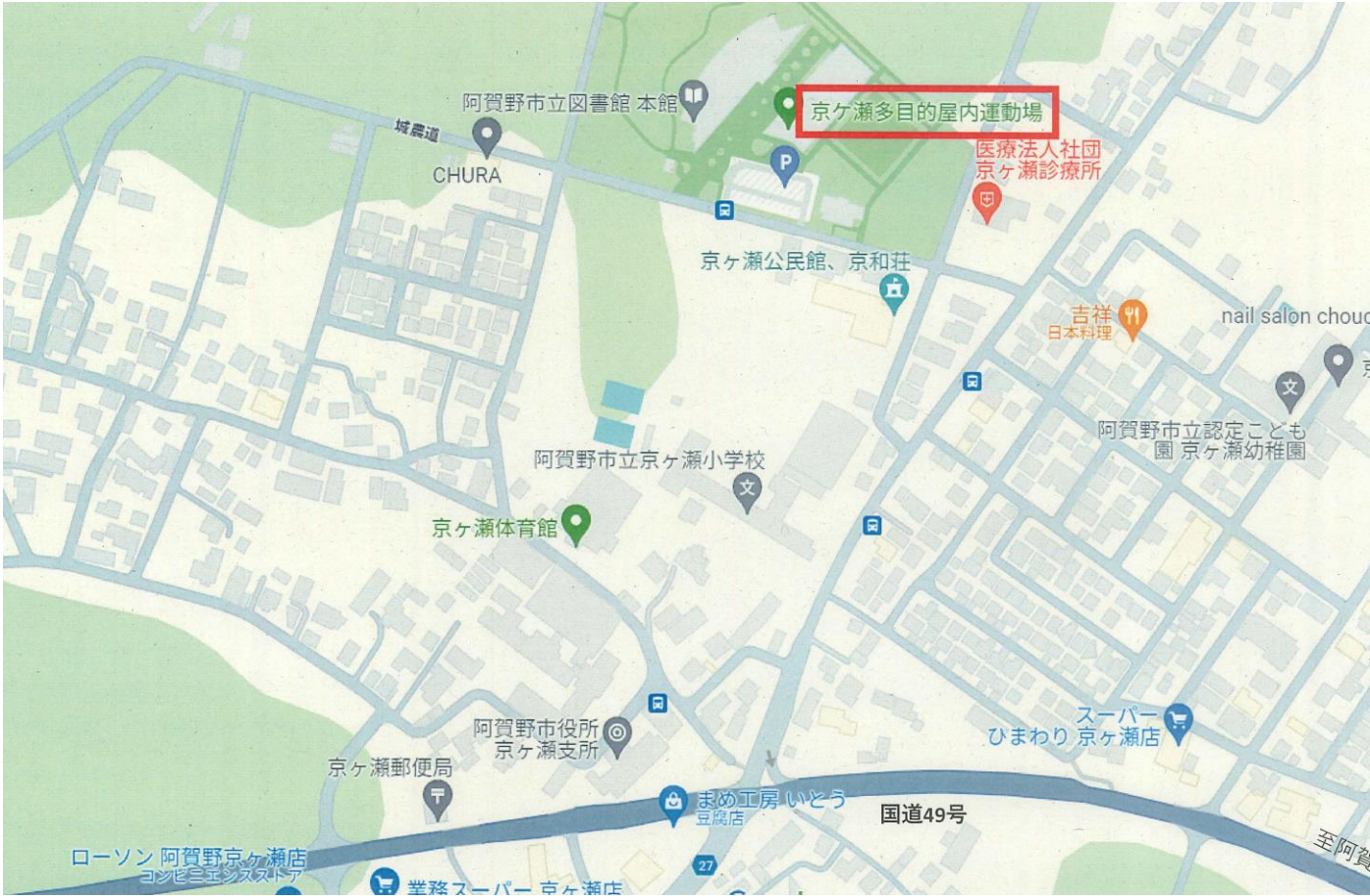
案 内 図